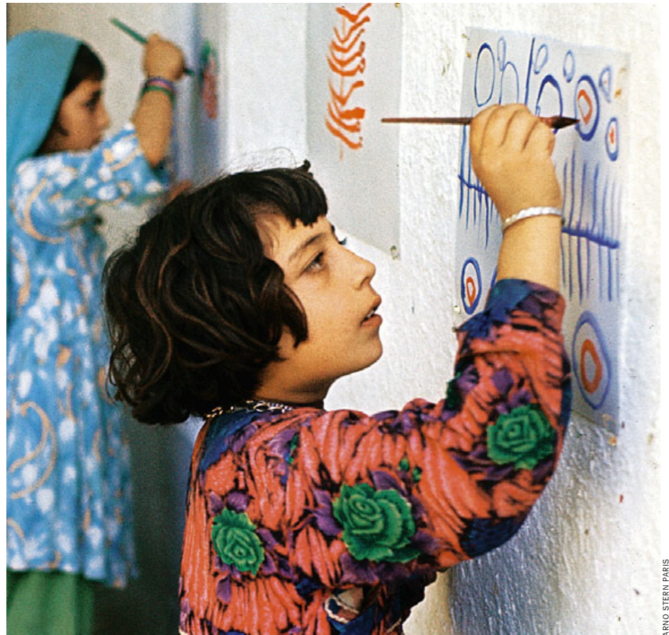
Stern-Projekt in Afghanistan (1969): „So scheint das Paradies zu sein“

Zugleich benötigten die Kinder heute ungleich mehr Zeit, sich auf das Malspiel einzulassen: „Sie sind ungleich mehr belas-