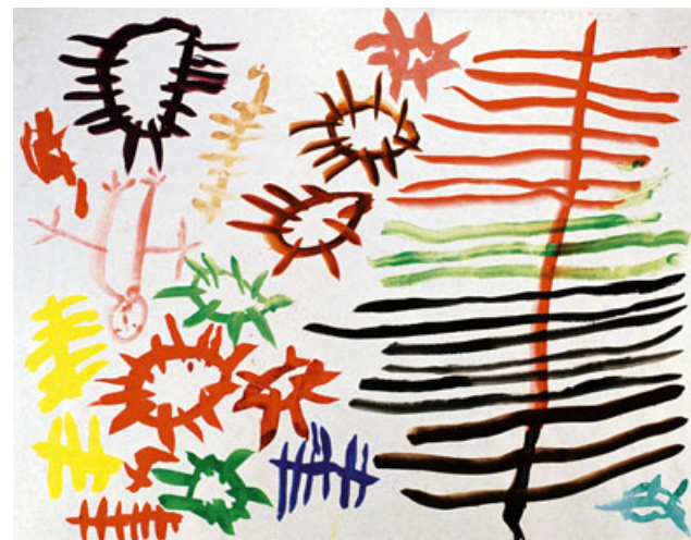
Stern-Übersichtstafel, Kinderzeichnung: Variationen der ersten Bildelemente