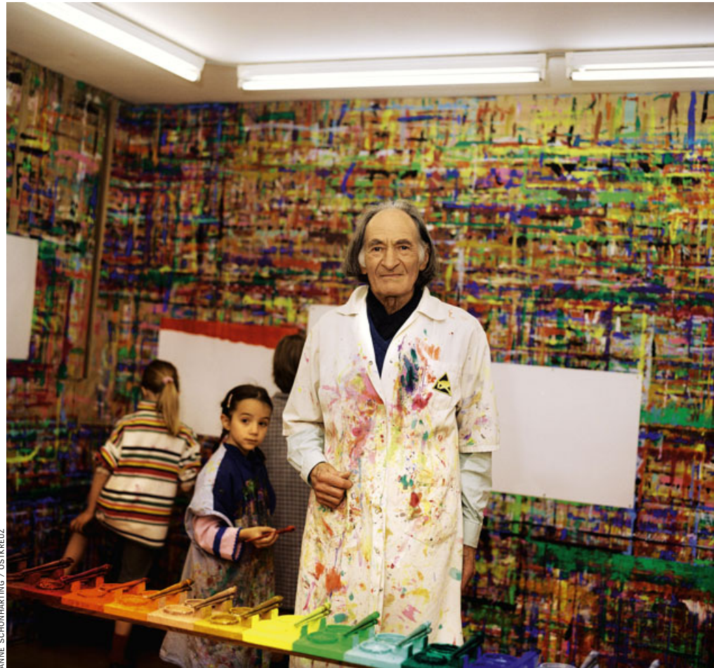
ANNE SCHÖNHARTING / ZOSTERKREUZ

Und damit der Ausgangspunkt für eine Forschung, die bis heute im Garten der Wissenschaften quer liegt wie ein Findling. Stern entwickelte, ausgehend vom Material der Kinderzeichnungen, eine revolutionäre Theorie der zeichnerischen Ursprache des Menschen. Expeditionen in schriftlose Gesellschaften und Vergleiche der frappierenden Übereinstimmungen der Bildsymbole von Kindern in aller Welt brachten ihn zu erstaunlichen Thesen über die Conditio humana : Das Reservoir der ersten Zeichen sei unabhängig von Kultur, Ethnie