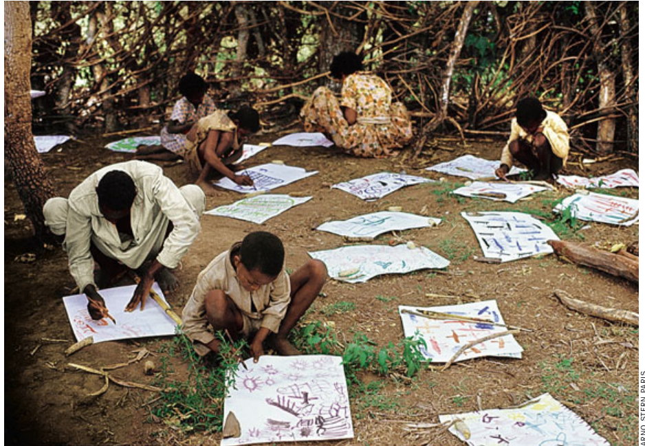
Stern-Aktion in Äthiopien (1972): „Eine schöne Blume – oder soll das die Sonne sein?“

Das sind die psychischen Nebenwirkungen des „Malspiels“, wie Stern es nennt – unabhängig vom Bildgegenstand. Doch Regelmäßigkeit, Vorhersehbarkeit fand er auch hier: Im Laufe der Jahre ging ihm auf, dass die ersten Malbewegungen aller Kinder entweder kreisende oder tupfende waren und dass aus diesen Bewegungen in